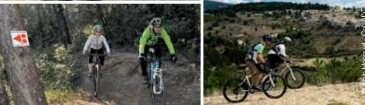
© Alain Hecquet - CC BY-ND / Vaucluse